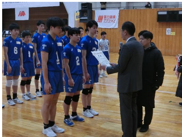
男子優勝 東海大札幌