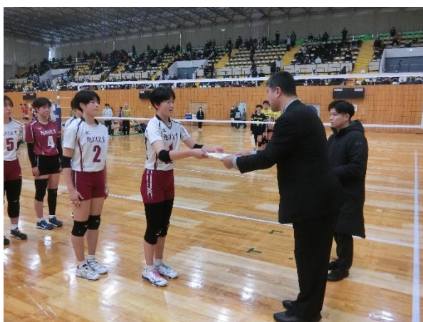
女子準優勝 旭川実業