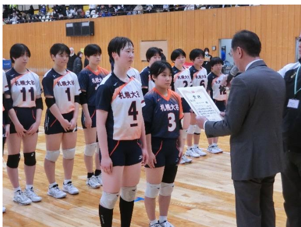
女子第3位 札幌大谷