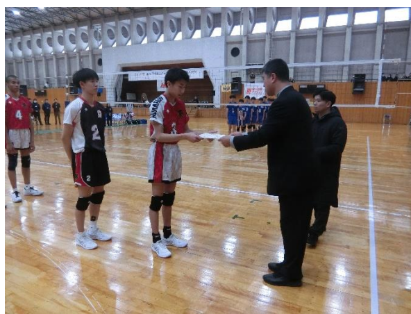
男子準優勝 北海道科学大学高校