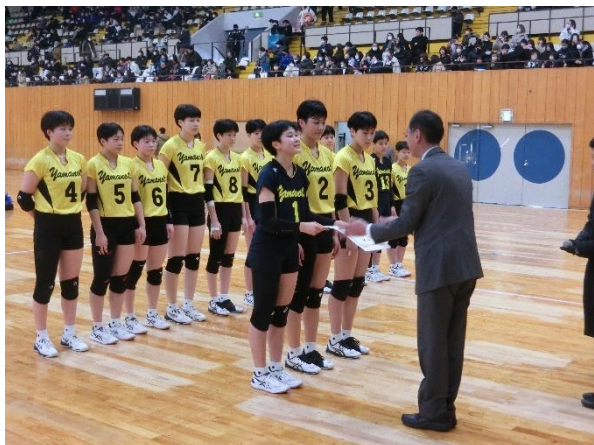
女子優勝 札幌山の手